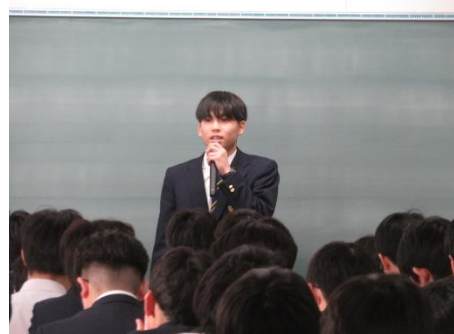
▲結団式－代表生徒による力強い「決意の言葉」がありました。