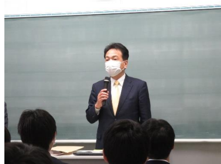
▲結団式－谷地田校長より、激励の言葉がありました。