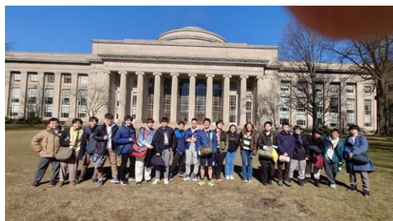
▲Massachusetts Institute of Technology (Aグループ)