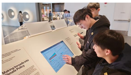
▲テクノロジーな展示に夢中です。(Aグループ)