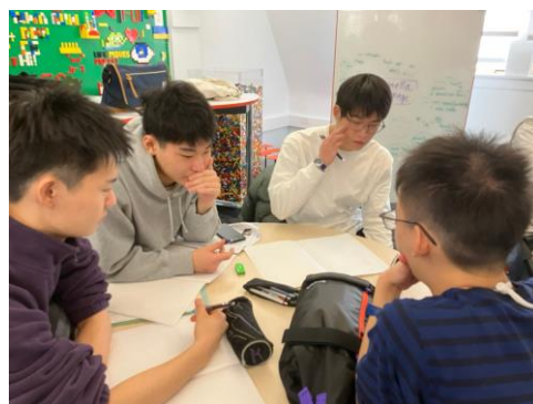
▲オールイングリッシュでディスカッションしています。(Cグループ)