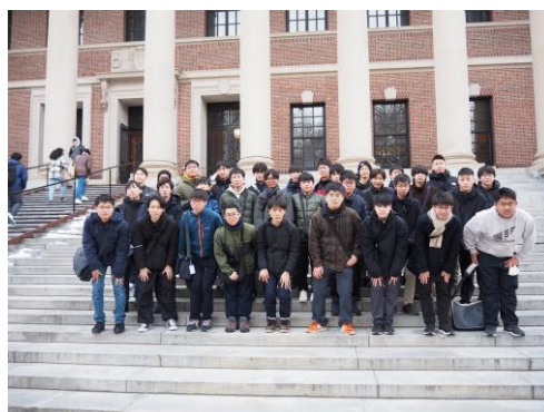
▲ハーバード図書館の前でパシャリ。(Bグループ)