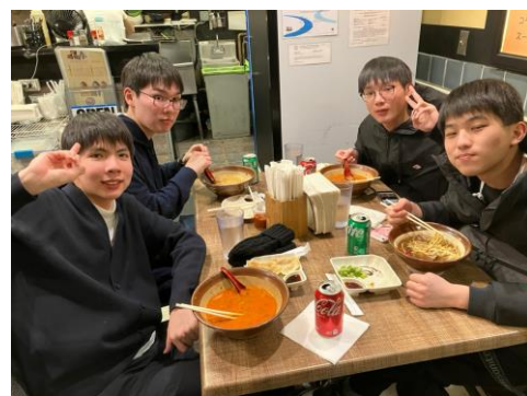
▲3日目にして日本食!?(Cグループ)