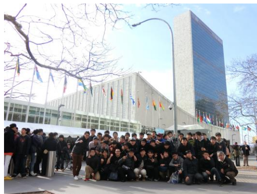
▲国連本部にて—いろいろな人種、国籍の人が世界平和のために働いています