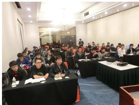
▲班長会議—最後まで気を抜かずに