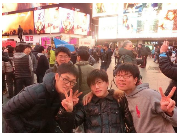
▲夕食後はタイムズスクエアで記念撮影