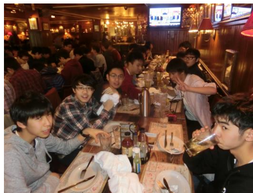
▲夕食—アメリカ最後の夜を級友と共に楽しみました