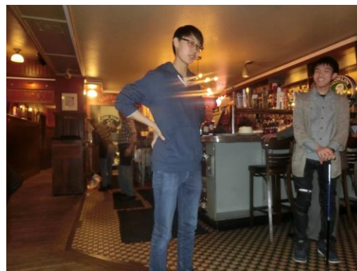
▲バースデイサプライズ！