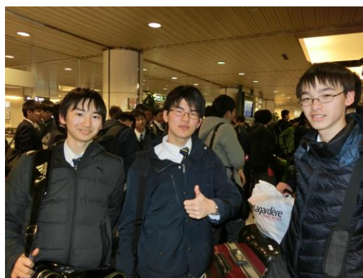
▲新千歳空港—無事に新千歳空港に到着。生徒は安堵の表情です。