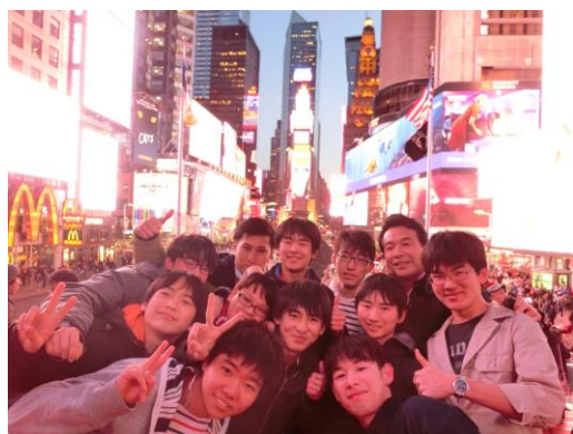
▲タイムズスクエア—たくさんの巨大な液晶スクリーンとネオンに大感動。