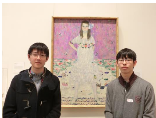
▲メトロポリタン美術館—素敵な絵と一緒に記念撮影。