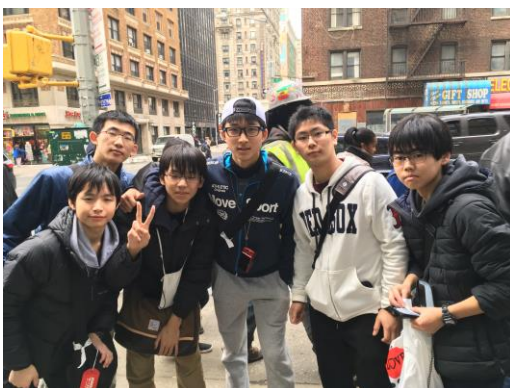
▲ニューヨーク自主研修—仲間とともに憧れの地を散策しました。