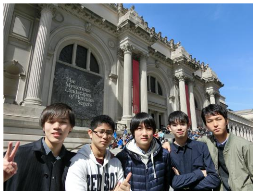
▲メトロポリタン美術館—美術館だけあって、センスのいい建物です