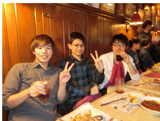
▲夕食—帰国前の全員での最後の食事。研修の思い出を語り合いました。