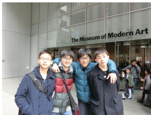
▲ニューヨーク自主研修—研修地として人気のあったMoMAでの撮影。