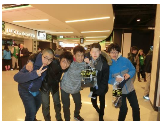
▲NBA観戦－生徒はTシャツなどグッズを購入し、応援体制万全です。