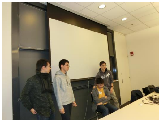
▲ワークショップ②—DAISHI の授業では巧みな話術で「商品」を即興で紹介。