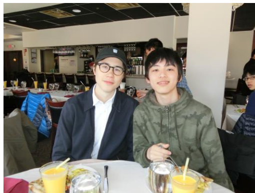
▲ハーバード生との昼食会—カレーを食べながらハーバード生と交流を実施。