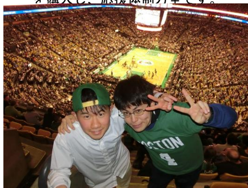
▲NBA観戦－アメリカ流の応援スタイルに生徒は圧倒されました。