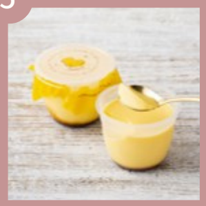
ろまん亭プリン 200円