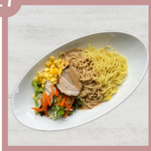
ラーメンサラダ 550円