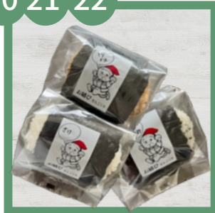
おにぎり各種 さけ190円 とりかま200円 チーズわかめ210円