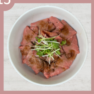
ローストビーフ丼 800円