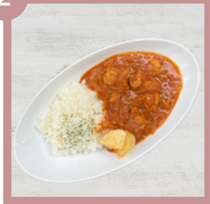
バターチキンカレー 600円