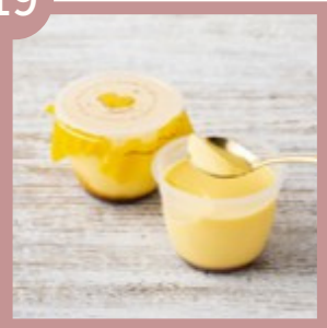
ろまん亭プリン 200円