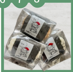
おにぎり各種 さけ190円 とりかま200円 チーズわかめ210円