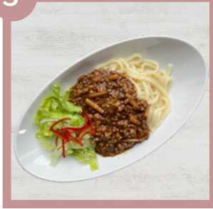
ジャージャーうどん 450円