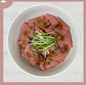
ローストビーフ丼 800円