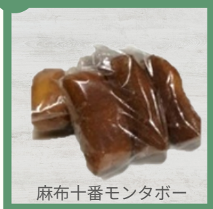
かりんとうドーナツ 200円