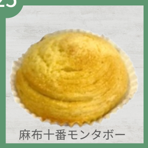
麻布十番モンタボー