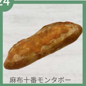
麻布十番モンタボー