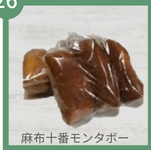
麻布十番モンタボー