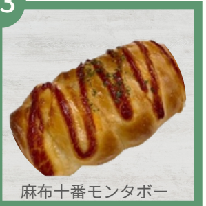
麻布十番モンタボー