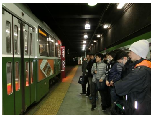
▲歴史あるトロントの地下鉄—生徒は毎日地下鉄を使って登校します。

メディカルスクールでは、2名のハーバード医学部生による講義、および施設案内をしていただきました。講義の内容は脳・神経・筋肉に関する内容。高校生物でも少し学習していましたが、模型を使って筋肉