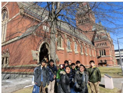
▲ハーバードメモリアルホールでの集合写真—青天とレンガの色彩が絶妙です。