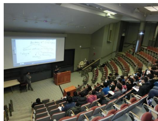
▲ハーバードメディカルスクール講堂—現役医学生による講義の様子。