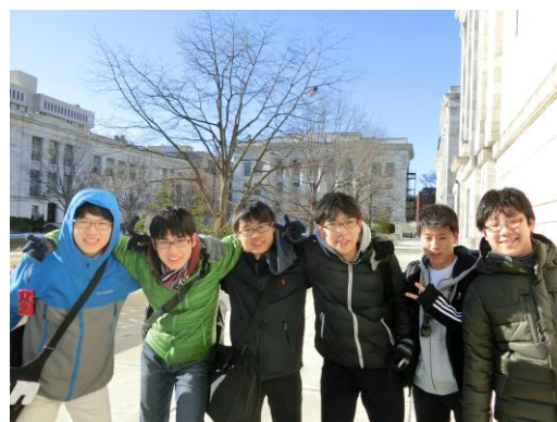
▲ハーバードメディカルスクール—快晴でしたが、ボストンは-12℃を記録。