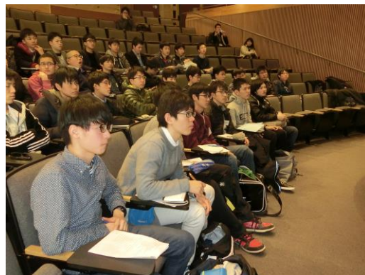
▲ハーバード大学での講義 —生徒は集中して講義に臨んでいます。

順調にプログラムが進みましたが、体調不良の生徒がいることは引率団として心配なところです。明日はボストン市内の天候悪化が懸念されており、日程が変更する可能性があります。生徒にはミーティングで、その旨を伝えました。(文責 28期生学年団)